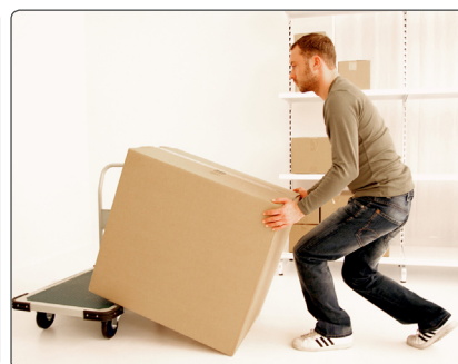
Skub varen helt på plads på fladvognen – brug underlaget som støtte i stedet for at løfte.