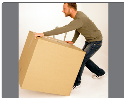
Parker fladvognen tæt på – tag fat i varen og kip den op på kanten.