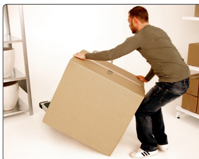
Kant og drej varen ind over fladvognen til varen støtter på den.