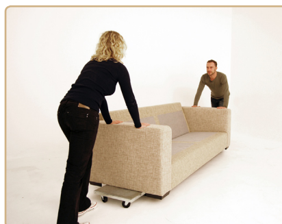
Tag fat i varen i ca. navlehøjde - skub varen af sted.