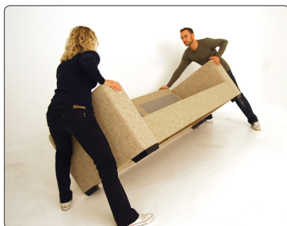
Stå ved den ene ende, bøj i knæene og kip varen op på kanten ved at presse med hånden og bruge kropsvægten.