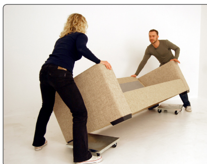
Placer transporthundene og sænk varen ned på dem.